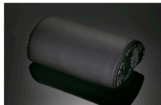
レザーネックパッド / ブラック