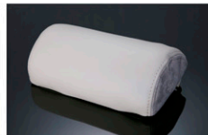
レザーネックパッド / アイボリー